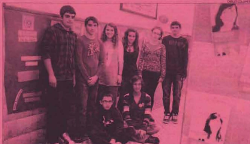
Els vuit candidats a les eleccions i campanya alternativa que organitza l'escola Santa Maria de Blanes.