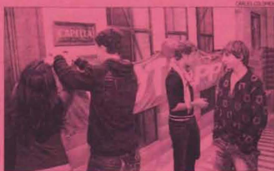
Representants de diferents partits enganxen els cartells.

alumnes. «El candidat el triaven entre ells i, en alguns casos, per als professors l'elecció ha estat molt sorprenent. Hi ha de tot: persones molt extrovertides, d'altres de més callades i en diversos casos han escollit el bon estudiant de la classe», comenta.